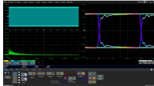
「解析オプション」による解析例