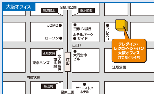
〒564-0063 大阪府吹田市江坂町 1-14-33 TCSビル 4F