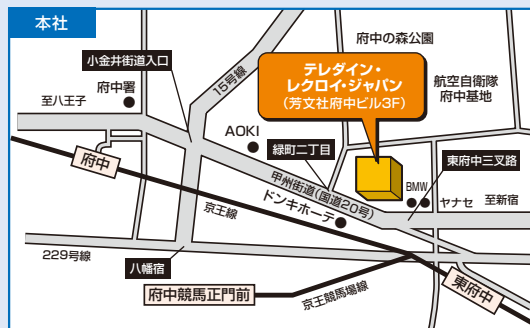
〒183-0006 東京都府中市緑町 3-11-5 芳文社府中ビル 3F